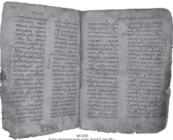
MS 2530 Syriac estrangela book script. Syria(?), late 5th c.

12-ാമനും, പോപ്പ് ഇന്നസെന്റ് 6-ാമനും (1360) സെന്റ് കാതറൈൻ മൊണാസ്റ്ററിയുടെ മഹത്വത്തെ ഊന്നിപ്പറഞ്ഞുകൊണ്ട് ഫണ്ട് സമാഹരണത്തിൽ സഹകരിച്ചിട്ടുണ്ട്.