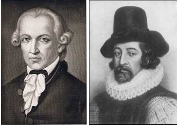
ഇമ്മാനുവൽ കാന്റ് ഫ്രാൻസിസ് ബേക്കൺ

﴿أَلَمْ تَرَ أَنَّ اللَّهَ أَنْزَلَ مِنَ السَّمَاءِ مَاءً فَأَخْرَجْنَا بِهِ ثَمَرَاتٍ مُخْتَلِفًا أَلْوَانُهَا وَمِنَ الْجِبَالِ جُدَدٌ بَيْضٌ وَحُمْرٌ مُخْتَلِفٌ أَلْوَانُهَا وَعُرَابٍ سَوِيَّةٌ سَوْدٌ﴾